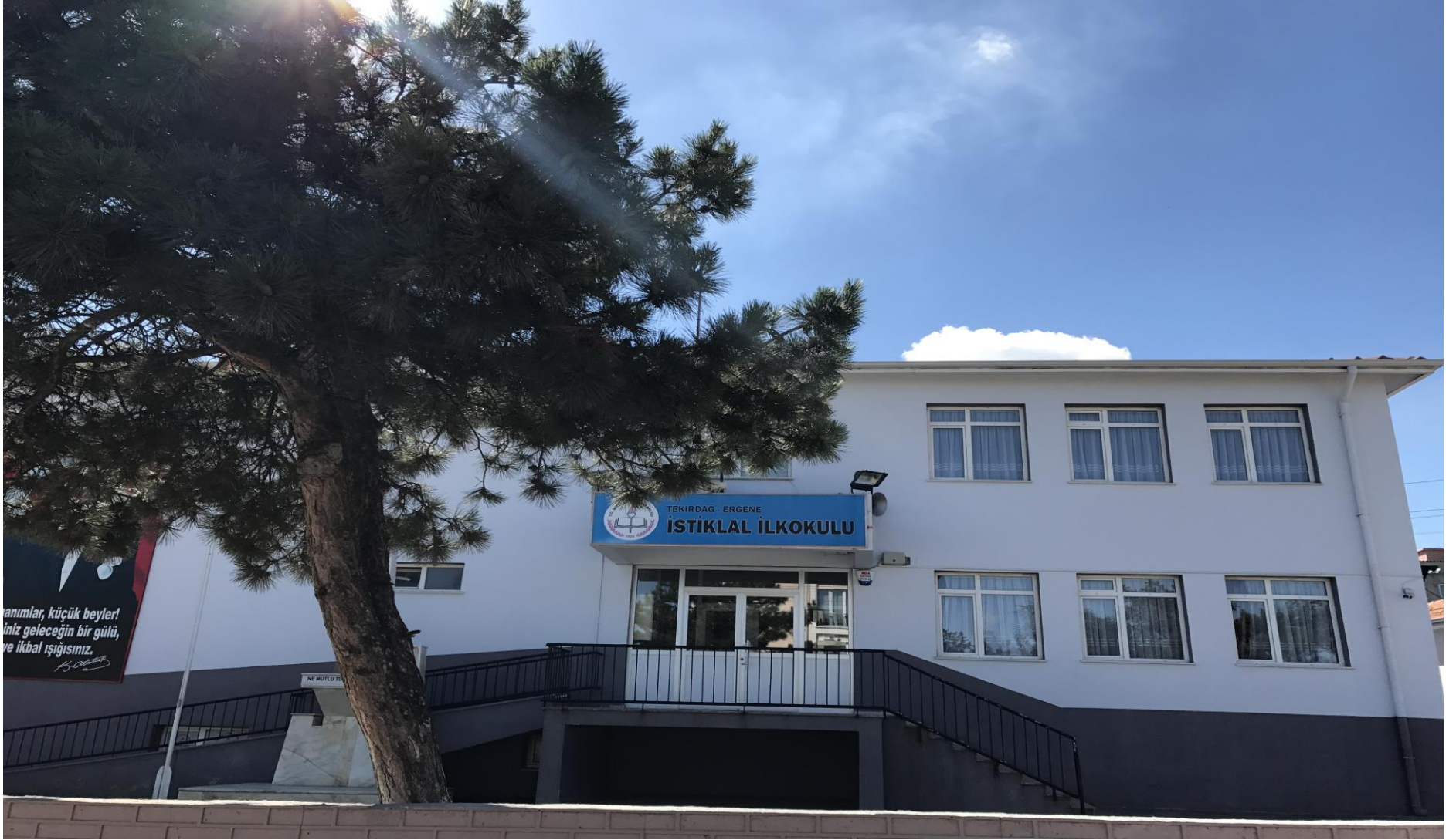
TEKİRDAĞ / ERGENE İSTİKLAL İLKOKULU